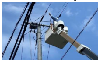
受電設備工事の様子（8月3日）

皆様には電力の契約切替手続きなど、お手数を おかけしますが引き続き よろしくお願いいたします。