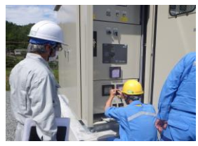
系統連系の様子(8月26日)

工事の状況と今後のスケジュール 8月26日に村内の自営線や蓄電池等と、東北電力の配電線設備とを接続しました。これにより、電力市場から不足電力の供給を受けることができます。今回の工事により全ての設備と連携し、作動試験も終了しました。 今後は電力の切替工事を進めて参ります。皆様にはお手数をおかけしますが、引き続きよろしくお願いたします。