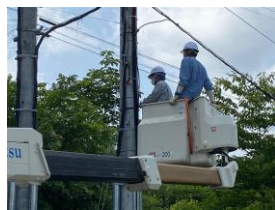
切替工事のイメージ

皆様には工事の際にお立会いをいただくなど、お手数をおかけしますが、引き続きよろしくお願いたします。